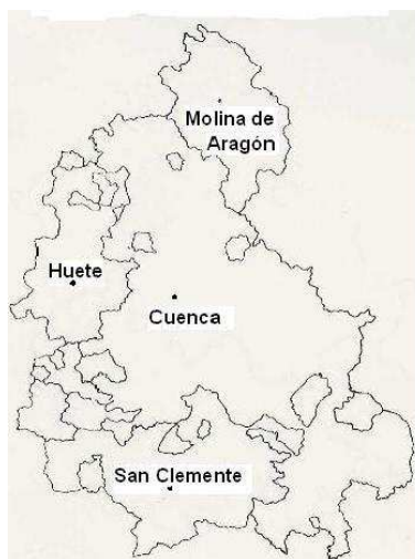
Cuenca en 1753 10

La Provincia de Cuenca comprendía cincuenta leguas desde Algar a Pozolloriente (N-S) y veinticinco leguas de Requena a Carrascosa (E-O), con los partidos de Cuenca, Huete, San Clemente, Priego, Cañete y Motilla. Belmonte y Tarancón pertenecían a La Mancha y Toledo.